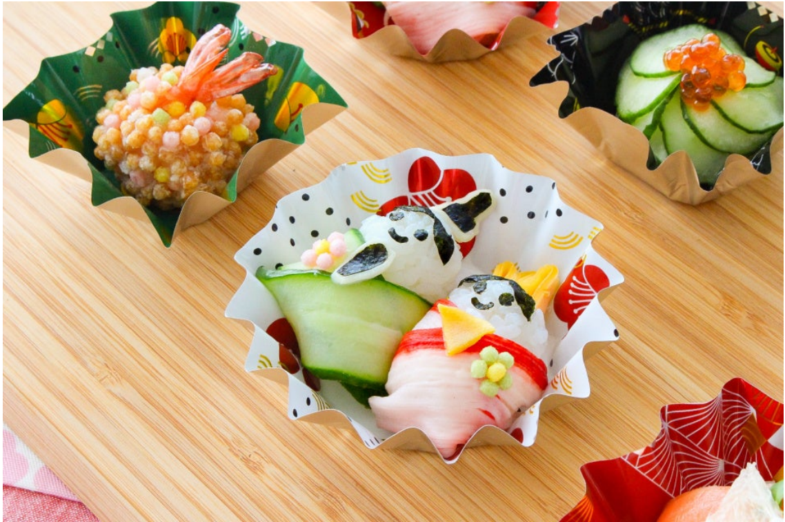
雑祭リシーンイメージ