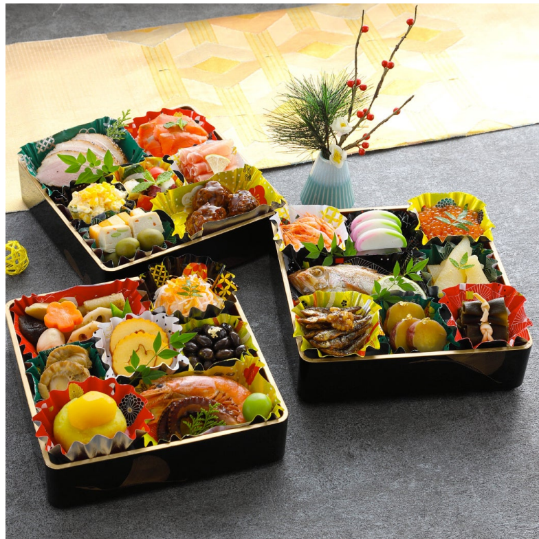
お重に盛付けイメージ