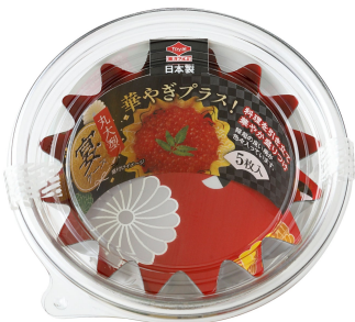
丸大型パッケージ